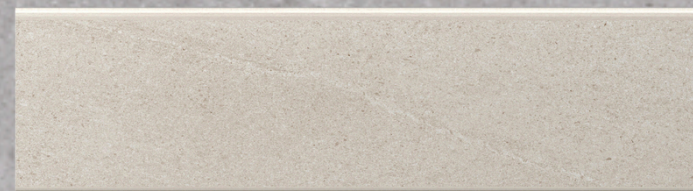
RODAPIÉ 60 SKIRTING BOARD 60