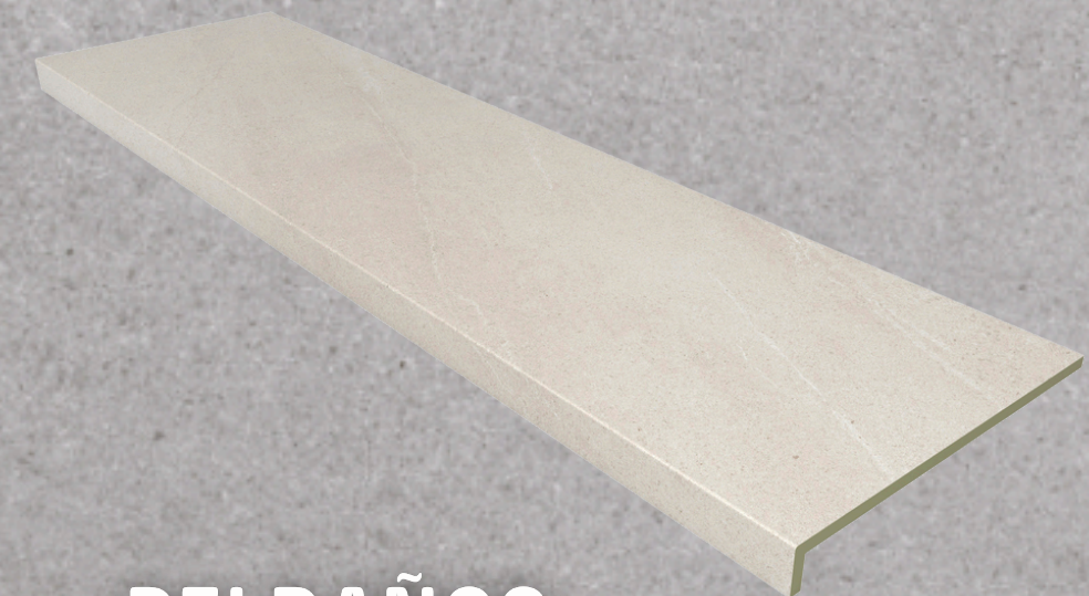
PELDAÑOS STAIR TREAD

* TAMAÑO PELDAÑO: REDONDEADO (120', *150') / RECTO (120', *150') STAIR TREAD SIZE: ROUNDED (120', *150') / STRAIGHT (120', *150')