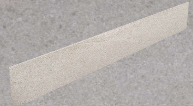
TAPAS PELDAÑOS STEPS COVERS