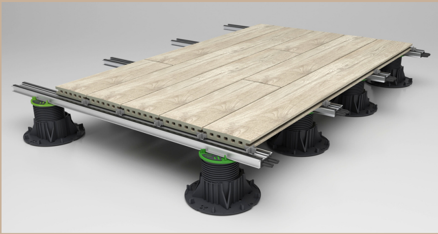
Colocación sobre plots y rastres Layout with battens and plots