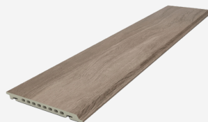
Fachada GA16 deck/ GA16 deck façade

970717 Natural MC830 970719 Grafito MC830 970716 Nogal MC830 970715 Haya MC830 970718 Gris MC830 970923 Caoba MC830 970922 Ébano MC830