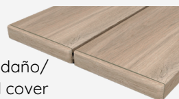
Tapa de peldaño/ Stair tread cover

970722 Natural MC770 970724 Grafito MC770 970721 Nogal MC770 970720 Haya MC770 970723 Gris MC770 970925 Caoba MC770 970924 Ébano MC770